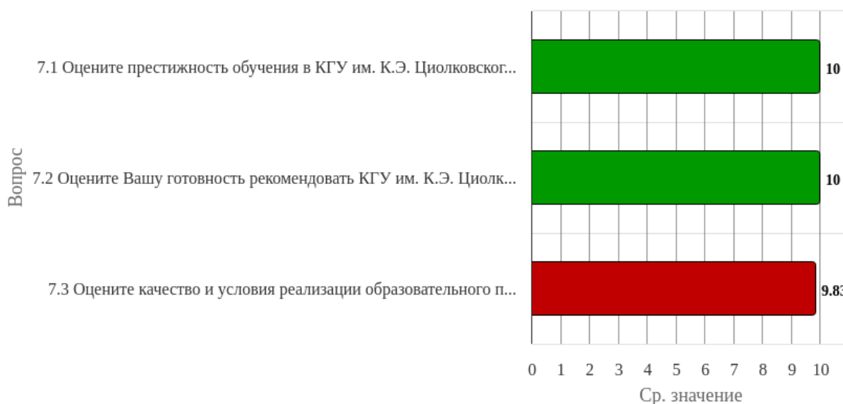
Рисунок 2.7.1 - Распределение показателей уровня удовлетворенности всех респондентов по блоку вопросов «Общая удовлетворенность обучением в университете»

Индекс удовлетворенности по блоку вопросов «Общая удовлетворенность обучением в университете» равен 9.94.